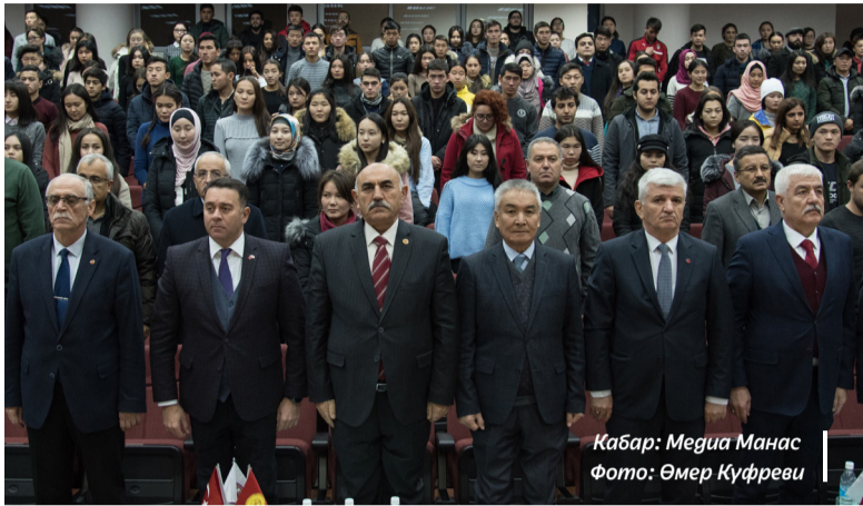
Кабар: Медиа Манас

Кыргыз-Түрк «Манас» университетинде, Түркия Республикасынын түзүүчүсү Улуу жол башчы Гази Мустафа Кемал Ататүрктү эскерүү аземи уюштурулду.