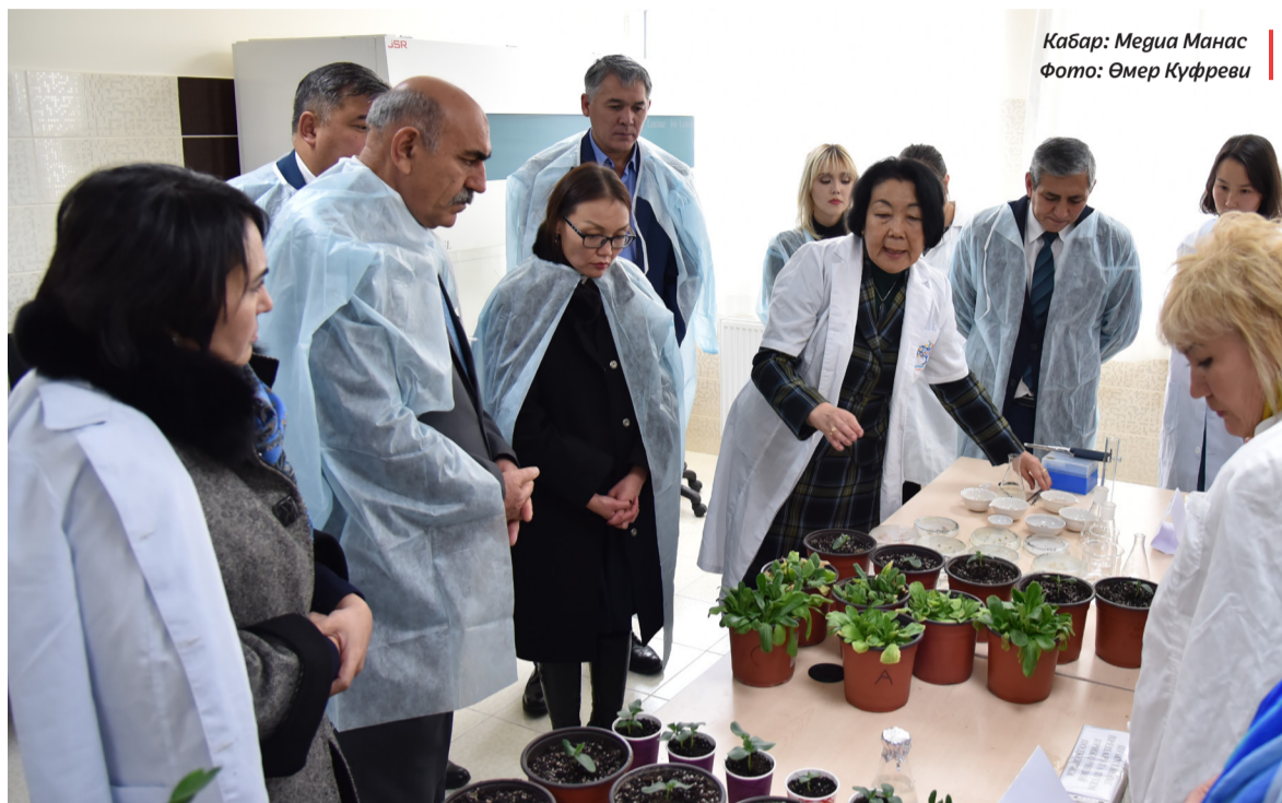
Кабар: Медиа Манас

С. Балжы Кыргызпатенттин жаңы ыкма жана технологияларды колдонуу маселесине басым жасап, буларга токтолду: «Кыргызпатент Кыргызстандын өнүгүүсү үчүн жаңы ыкмалар, технологиялар жана инновацияларды өнүктүрүү тармагында колунан келгенин жасап жатат. Албетте, дайыма эле мүмкүнчүлүк боло бербейт. Маанилүүсү колдогу нерсени туура пайдалана билүү.